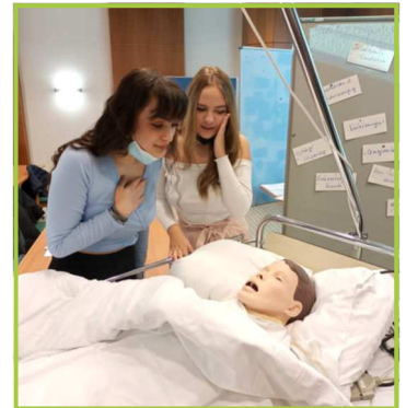
Elektrisch gesteuerte Puppe

Nach einem lehrreichen und spaßigen Nachmittag in Linz wurden die Schülerinnen und Schüler entlassen.